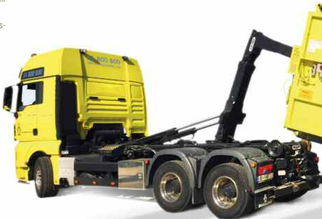
Krokliftbil som betjener en avfallspresse.

Fellesadministrasjonen utgjorde 9 stillinger i konsernet. I tillegg var det 1 seksjonsleder og 5 driftsledere i operativ funksjon. Målsettingen er å ha en liten administrasjon. Det medfører at noen i administrasjonen utøver flere stillingsfunksjoner. Det var ingen stillingssøkning i administrasjonen i 2011.